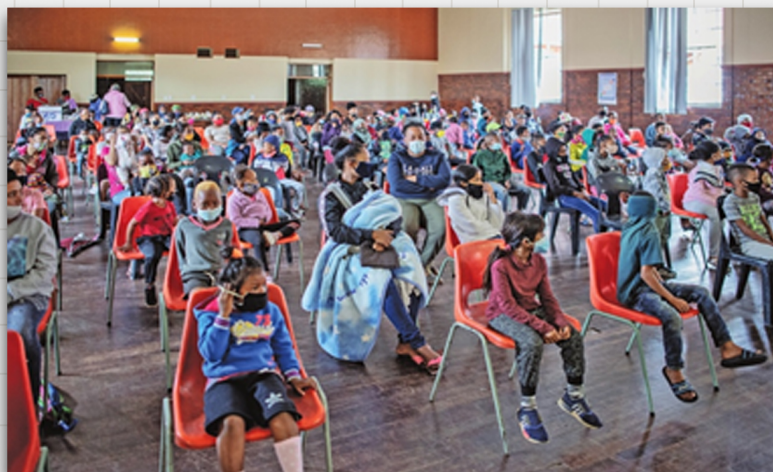
About 300 children gather in Coronationville Secondary School as they wait for a food and goods distribution ahead of Christmas, led by grassroots charity Hunger Has No Religion, in Johannesburg, South Africa, on Wednesday.

Jika pada caption jenis identification bar dan cutline yang perlu disebutkan adalah siapa dan apa yang sedang dilakukan, caption summary ini memuat penjelasan lebih lengkap. Caption summary berisi tentang siapa yang berada di dalam gambar, apa yang sedang dilakukan, kapan kejadiannya, di mana tempat terjadinya, dan kenapa hal tersebut dilakukan. Dengan kata lain, caption ini memuat semua unsur what, where, when, who, dan why . Mari kita lihat caption summary berikut.